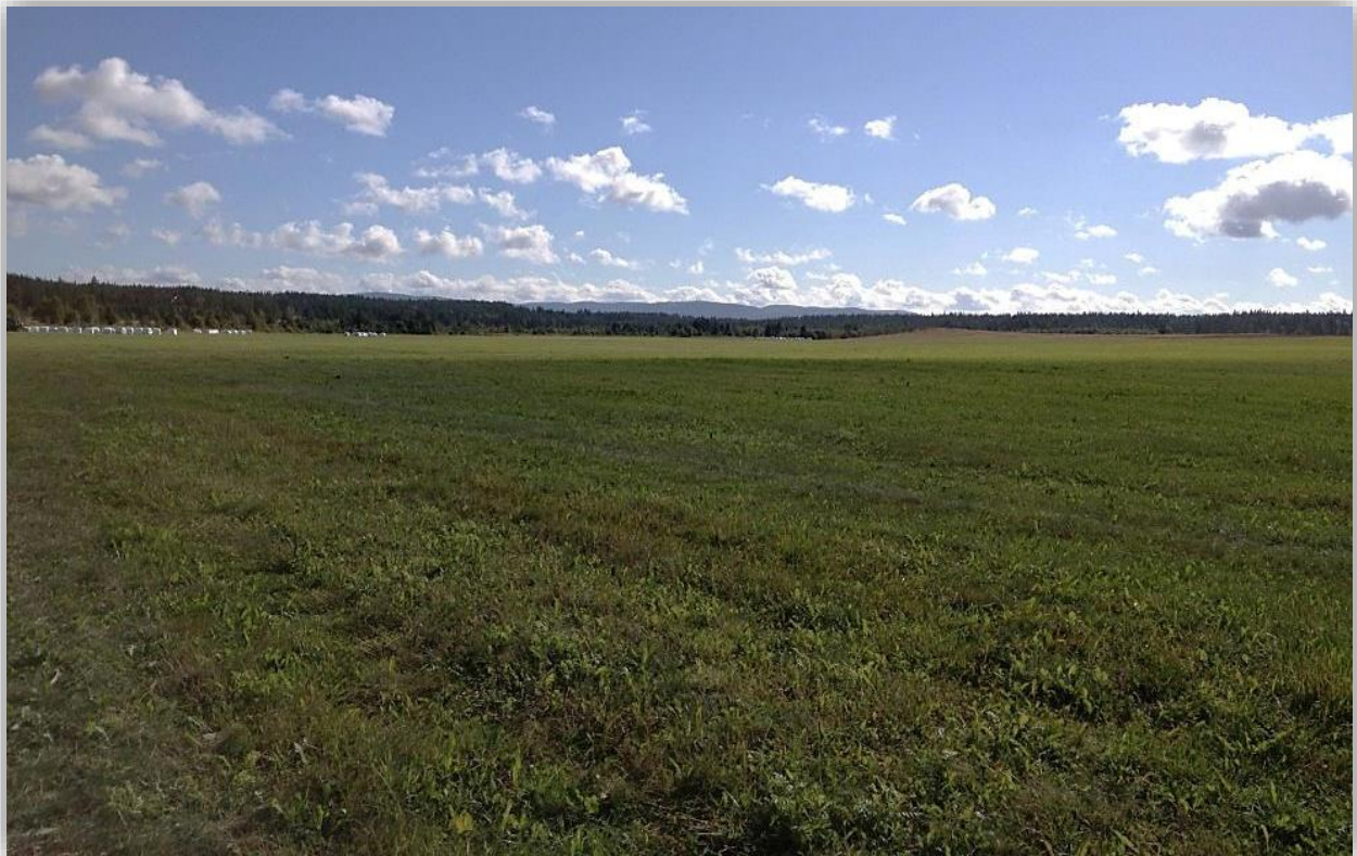
Fallskjermhoppfeltets område A på Rødsmoen øvingsområde, Åmot.

Leietaker må koordinere driften med Forsvaret, og Forsvarets behov vil være styrende. Forutsetningen for leie er at områdene slås minimum en gang per år, fortrinnsvis innenfor perioden 23. juni til 15. august. Område D skal som utgangspunkt slås 3 ganger per sesong (medio juni, juli og august), dog avhengig av vær/tilvekst. Ved behov for to slåtter på øvrige arealer, avtales tidspunkt for 2. slåtten nærmere med Forsvaret.